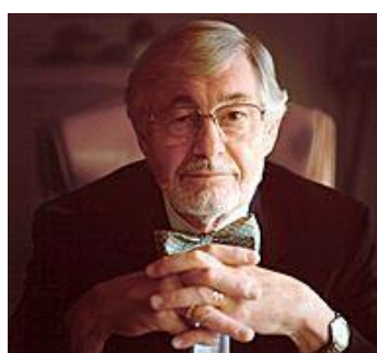
ブローネマルク博士